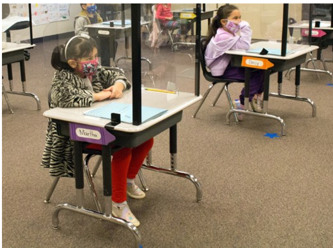
Los estudiantes de Grandhaven participan en instrucción limitada en persona durante COVID-19. Los escritorios de los estudiantes tienen pantallas de plexiglás alrededor. Los estudiantes y el personal usan cubrebocas. Todas las superficies se limpian y luego se esterilizan con varas de luz ultravioleta.