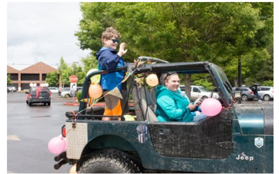
Los estudiantes de Newby desfilan frente a sus maestros y personal escolar para ayudar a mantener las relaciones durante el cierre de COVID-19