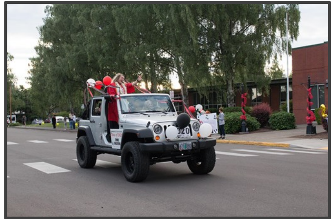
Los graduados de 2020 desfilan frente al personal de la escuela primaria en la escuela a la que asistieron

El Distrito Escolar de McMinnville ganó el primer lugar en los Premios Magna 2021, uno de los cinco distritos en la nación que recibió tal honor. El premio de la Asociación Nacional de la Directiva Escolar reconoce la innovación y la creatividad para ayudar a aumentar el rendimiento de los estudiantes, eliminar las barreras para los estudiantes vulnerables o marginados y demostrar el éxito a lo largo del tiempo. El distrito ganó el primer lugar en la categoría de distritos con matrículas entre 5,000 y 20,000 estudiantes.